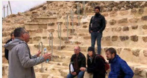
משתתפי הכינוס בסיור בהרודיון

בחודש מרס ערכה החטיבה כינוס בין־לאומי בתחום שלהי העת העתיקה , שנשא את הכותרת Palaestina on the Map of Late Antique Mobility and Migration . במהלך הכינוס ערכו המשתתפים סיור מודרך באתר הארכאולוגי הרודיון. את הכינוס, שנמשך שלושה ימים, הובילה חברת האקדמיה פרופ' מארן ניהוף.