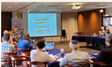
משתתפים בכינוס הבין-לאומי החמישה-עשר בסדרת "מג'אהליה לאסלאם"

ההרצאה השנייה התקיימה בחודש ינואר, ונשא אותה זוכה פרס נובל בכלכלה לשנת 2002 פרופ' דניאל כהנמן מאוניברסיטת פרינסטון. הרצאתו בבית האקדמיה נשאה את הכותרת Thinking about Thinking . הוביל את האירוע יו"ר החטיבה פרופ' הרט.