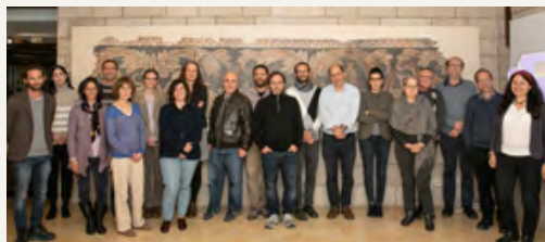
מפגש הפורום הרב-תחומי העוסק בשלהי העת העתיקה