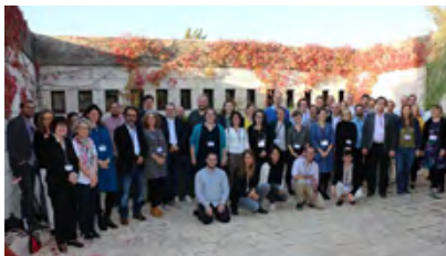
משתתפי כינוס GISFOH השלושה־עשר

הסכם שנחתם בשנת 2009 בין האקדמיה לקרן אלכסנדר פון הומבולדט הגרמנית (Alexander von Humboldt Foundation) הוביל לכינון סדרת כינוסים דו־לאומיים רב־תחומיים במדעי הרוח והחברה, בהשתתפות כחמישים חוקרים צעירים – ישראלים וגרמנים. בכל שנה נבחרים ארבעה חוקרים ישראלים וארבעה חוקרים גרמנים מארבעה תחומים שונים במדעי הרוח והחברה, ויחד הם משמשים הוועדה המארגנת של הכינוס. הכינוס נערך בישראל ובגרמניה לסירוגין. מטרותיו הן להפגיש חוקרים צעירים מצטיינים מתחומים שונים ולאתגר אותם לחשוב ולחקור מחוץ לגבולות תחומי הדעת שלהם, לאפשר שיח וחשיבה הדדיים וליצור ערוץ לחילופי ידע אקדמי רב־תחומי. את המיזם מרכזת מטעם האקדמיה חברת האקדמיה פרופ' בילי מלמן.