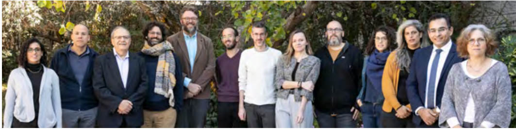
משתתפי פורום צעירי מדעי הרוח והחברה, תשפ"ג

זה כעשרים שנה שפועל בחטיבה פורום צעירים . בכל קבוצה בפורום משתתפים חוקרות וחוקרים צעירים ומצטיינים הנבחרים על ידי ועדה מטעם החטיבה, על פי קריטריונים של מצוינות וכישורים אקדמיים. בראש כל קבוצה עומדים חבר או חברת האקדמיה.