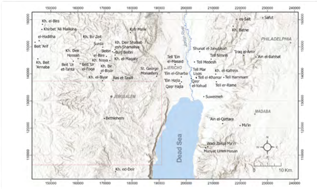
מפת יהודה ועבר הירדן המרכזי. באדיבות פרופ' חיים בן־דוד ורוחמה בנפיל ובעזרתו של עופר קליין

העבודה על כרך 4 (Sacred Places) נמשכת אף היא לקראת פרסומו בפורמט דיגיטלי. סוניה אנדרייבה אוספת את הדיונים הארכאולוגיים ואת הביבליוגרפיה על הכנסיות המזוהות באתריהן, וכעת העבודה מתמקדת בחלק העוסק בכנסיות, בקברים קדושים, בקסנודוקיה (אכסניות לצליינים), במקדשים בגאניים ובבתי כנסת המזוהים בשמם.