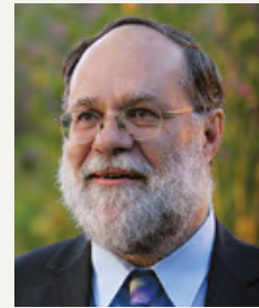
פרופ' סרג'יו הרט יו"ר החטיבה

בחטיבה למדעי הרוח 69 חברים מתחומים שונים במדעי הרוח והחברה: אנתרופולוגיה, ארכאולוגיה, בלשנות, דתות, היסטוריה, היסטוריה של עם ישראל, הלשון העברית, המזרח הקדום, לימודים קלאסיים, כלכלה, מדע המדינה, מזרח אסיה, מחשבת ישראל, מקרא, משפטים, סטטיסטיקה, ספרות, פילוסופיה, פסיכולוגיה ותכנון ערים. בראש החטיבה עומד פרופ' סרג'יו הרט. פעילות החטיבה כוללת תמיכה במפעלי מחקר, כינוסים בין-לאומיים, ימי עיון והרצאות ובחינתם של נושאים שונים הנוגעים לתחומי מדעי הרוח והחברה. כמו כן מקדמת החטיבה פעילויות שונות ביוזמת חבריה.